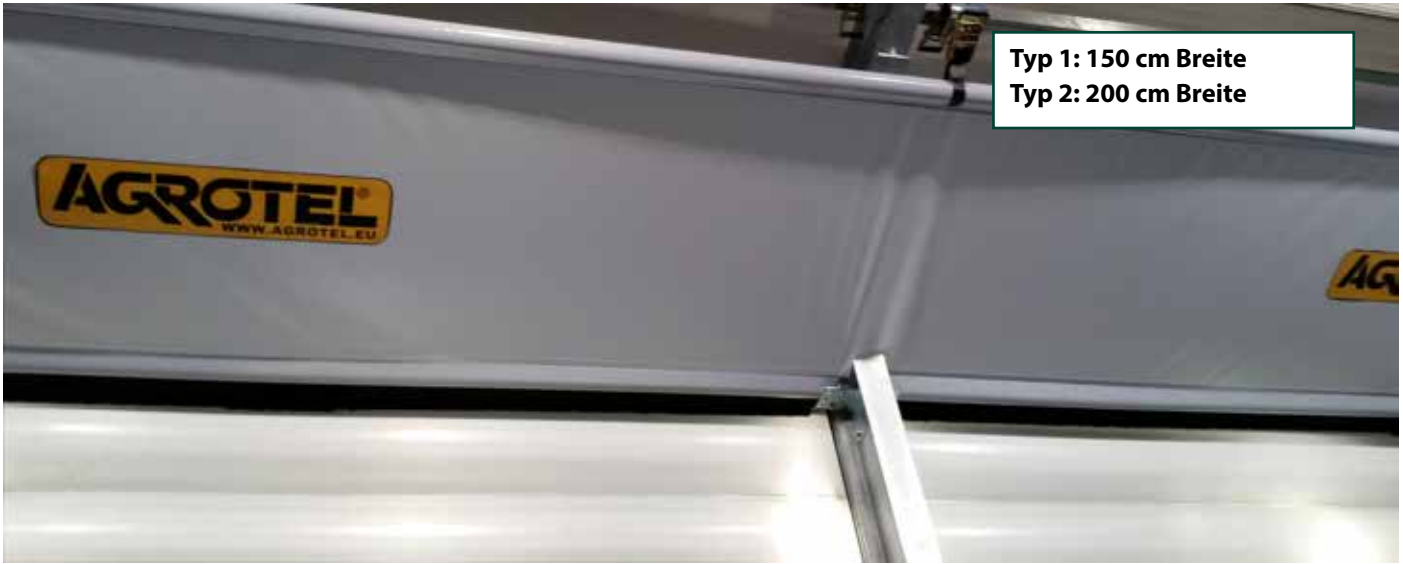
Die AGROTEL Zuluft-Leitplane von unten, innen

für „geleitete“ Zufuhr der Frischluft über die Traufe