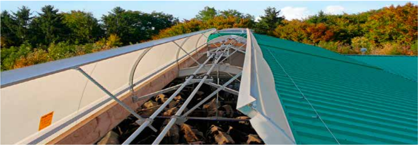
First beidseitig geöffnet, mit zwei Antriebswellen

Besonders bei Stallungen ist eine ausreichende und regelbare Entlüftung unbedingt erforderlich. Durch die ausgeklügelte Form des Systems entsteht ein sehr guter Kamin-Effekt und somit ein besonders effizienter Abzug der verbrauchten Luft.